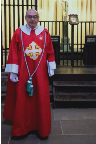
El Delegado para España de las ODDCS ante el Santo Cristo de Lepanto.