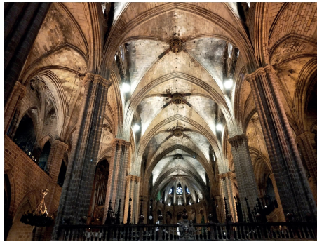
Bóveda de la nave central.