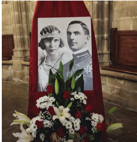
Sus Majestades el Rey Don Humberto II y la Reina Doña María José de Italia.