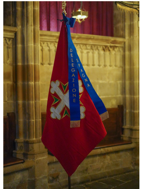
Bandera de la Delegación para España de las ODDCS.