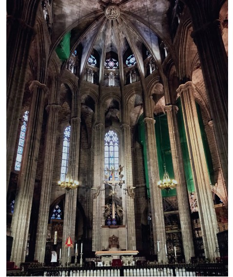
Altar Mayor de la Catedral de Barcelona