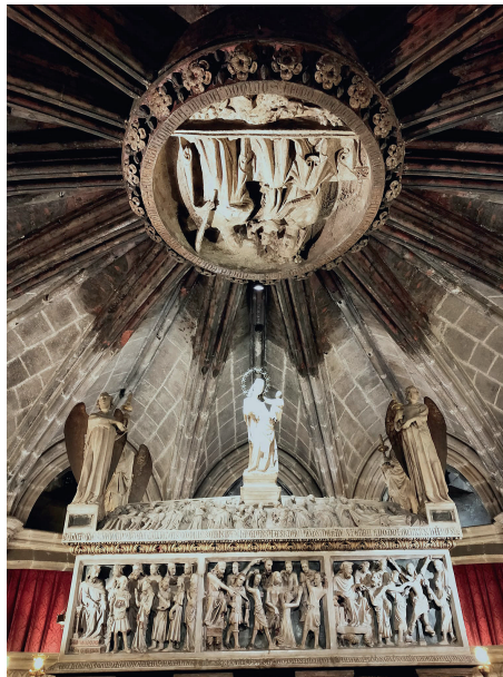
Clave de bóveda sobre el sepulcro de Santa Eulalia.

Goethe decía que “La arquitectura es una música de piedras y la música, una arquitectura de sonidos”; e inspirándose-