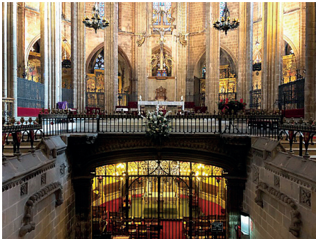
La Cripta de la Catedral de Barcelona bajo el Altar Mayor