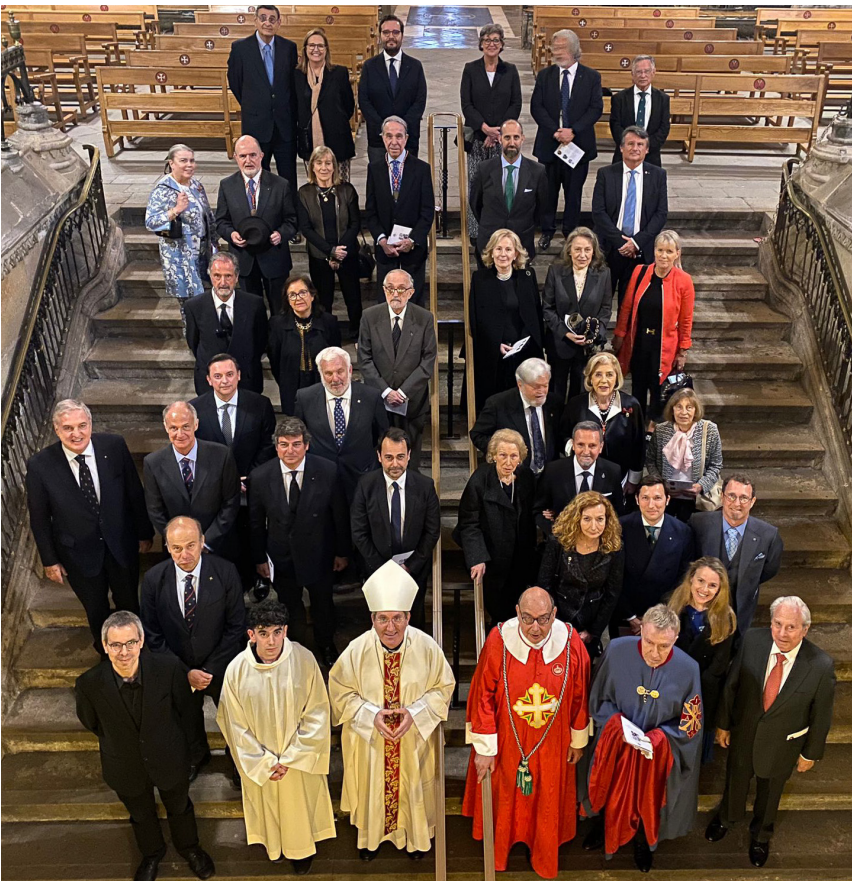
Fotografía de familia de los asistentes a la Santa Misa por SS.MM. el Rey D. Humberto II y la Reina Doña María José de Italia.