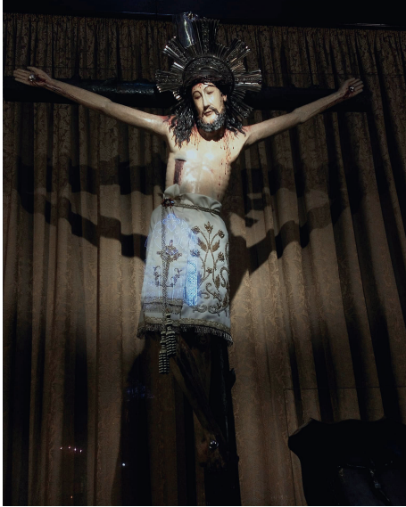
El Santo Cristo de Lepanto