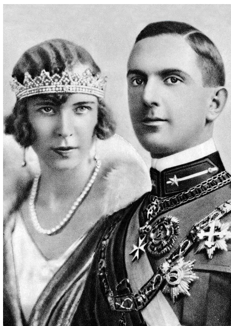
Fotografía del Rey Humberto II y la Reina María José de Italia

tecostés, como expresión de la fuerza que nos otorga el Paráclito en la peregrinación terrenal hasta nuestra propia y particular ascensión. Entraban y percibiendo, a la izquierda, la imagen sacra y revestida de una luz fulgurante, recuperada tras su restauración, del Santo Cristo de Lepanto, la maravillosa talla gótica del siglo XIII, que según la