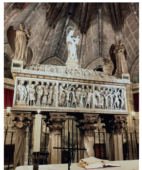
Altar de la cripta y sepulcro de Santa Eulalia

nos en su sentencia, podemos afirmar que la Catedral de Barcelona es una grandiosa sinfonía sacra, con sus cuatro tiempos que se perciben en sus cuatro elementos: la tierra firme para fijar la seo barcelonesa, el aire que conduce hacia el cielo que es nuestro destino, desde donde podemos adivinar, en el horizonte cercano, el agua del mar, y todo ello acrisolado por el fuego del fervor y del Credo.